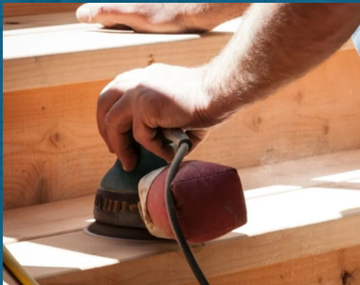
Voorbeeld egale trap met rechte trapneuzen Foto 1