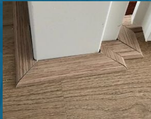
Voorbeeld afwerking plakplinten Foto 1