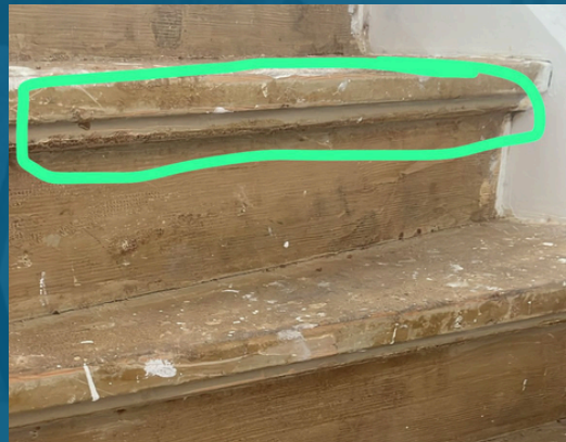
Voorbeeld NIET rechte trapneuzen en oneffenheden Foto 2